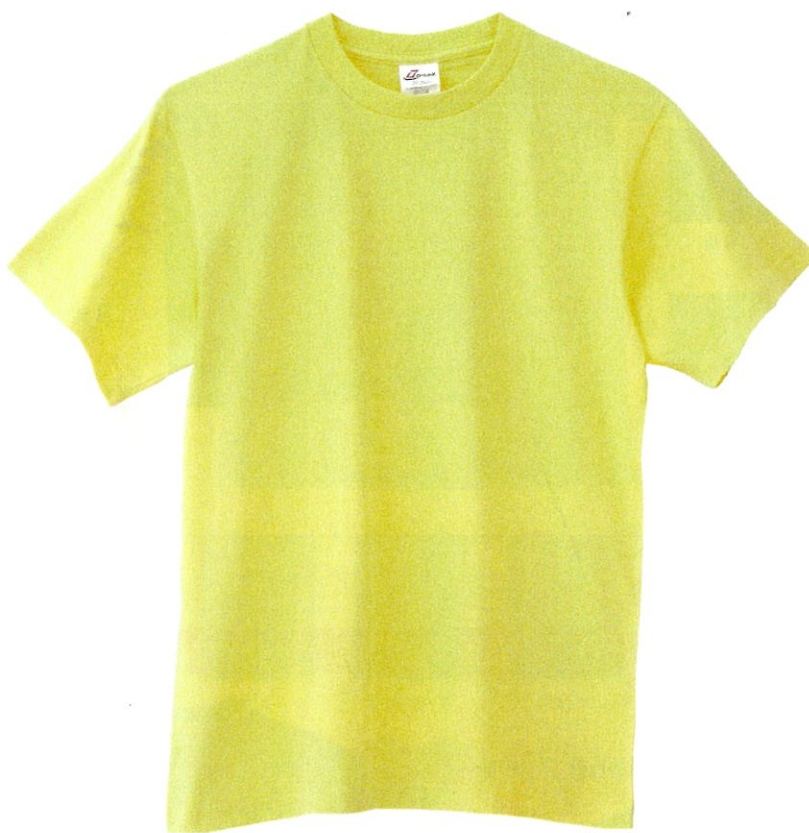
19000 7 イエロー

大陸気候を利用し栽培された最高級の綿糸です。通常の綿糸よりも天然の油脂分が多く、しなやかで肌触りのよい、快適な着心地です。プレミアムコットンは毛足(繊維)がとても長いので、ふんわりとした仕上がりで、なめらかになります。