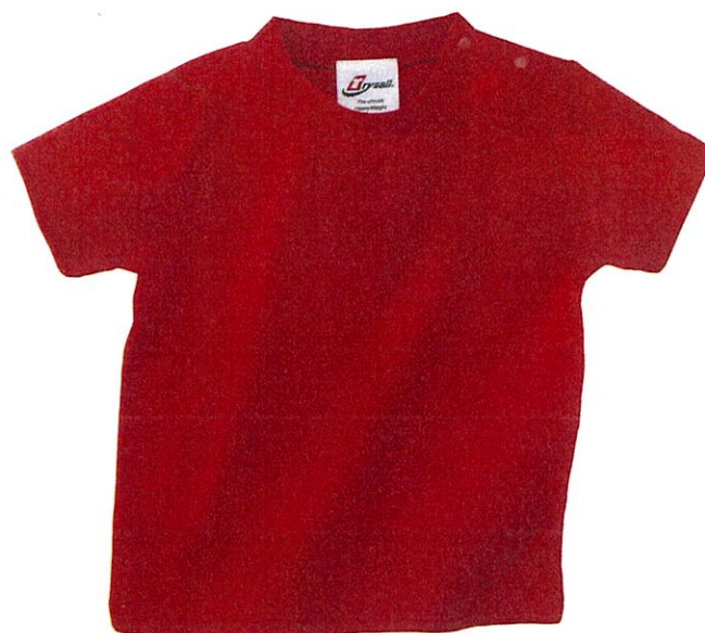
19001 4 レッド